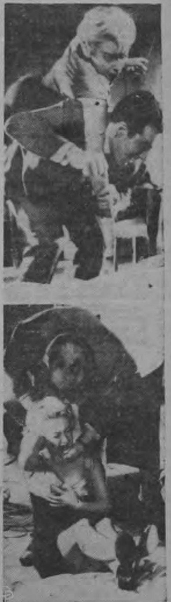
El actor Michel Piccolo, que trabaja en una nueva película en París con la estrella de cine francés Martine Carol, no está en forma perfecta para el judo (arriba) al lanzarla a ella por encima de su hombro. Tampoco está en el librito la escena (abajo) donde la actriz refuerce el rostro adolorido después de caer en una forma que distendió un músculo del cuello.