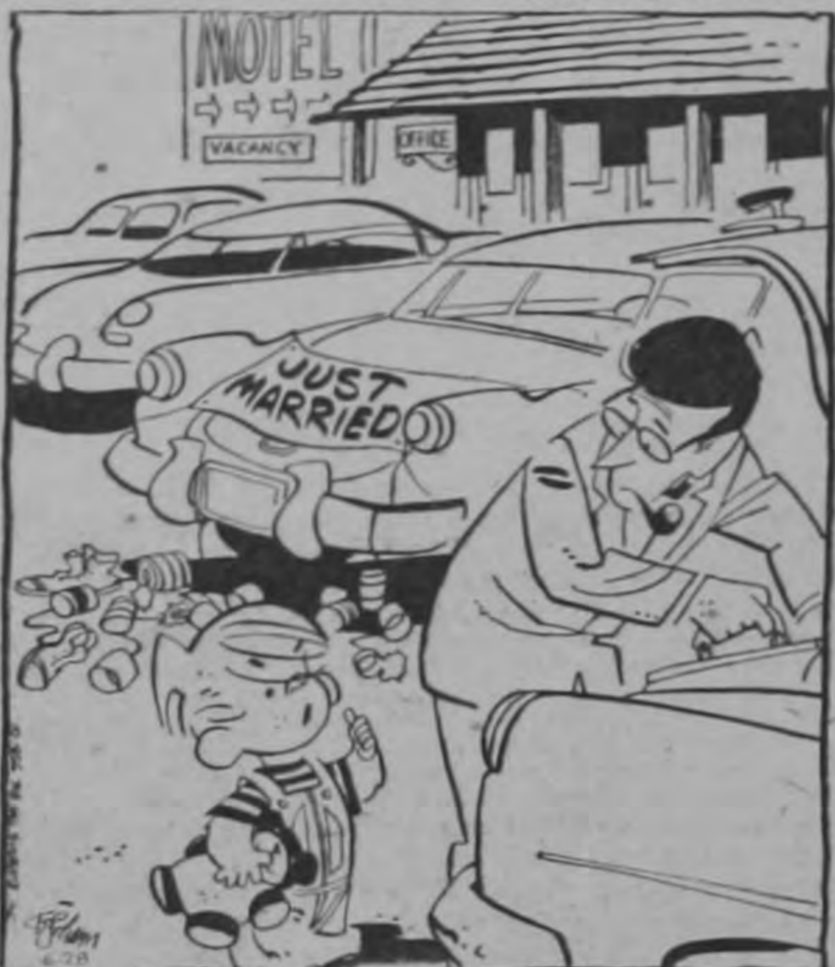
—Te advierto que no fui yo quien colgó todas esas latas vacías en ese automóvil...

El Comité del Programa Nacional de Coordinación Hospitalaria ha aprobado la realización de estudios sobre las facilidades asistenciales en general de las diferentes áreas del país. Esos estudios — encomendados a la firma Gordon A. Friesen Asociados — son indispensables para la más acertada estructuración de un programa de coordinación hospitalaria de proyecciones nacionales.