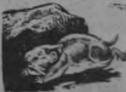
LAZAR DE DIA. Deseñado by King Deane Studios.

...EL BUHO NEVADO, QUE HABITA LAS TUNDRAS ARTICAS. EN EL VERANO NO HAY NOCHE ALLI. POR TANTO, SI QUIERE COMER, TIENE QUE