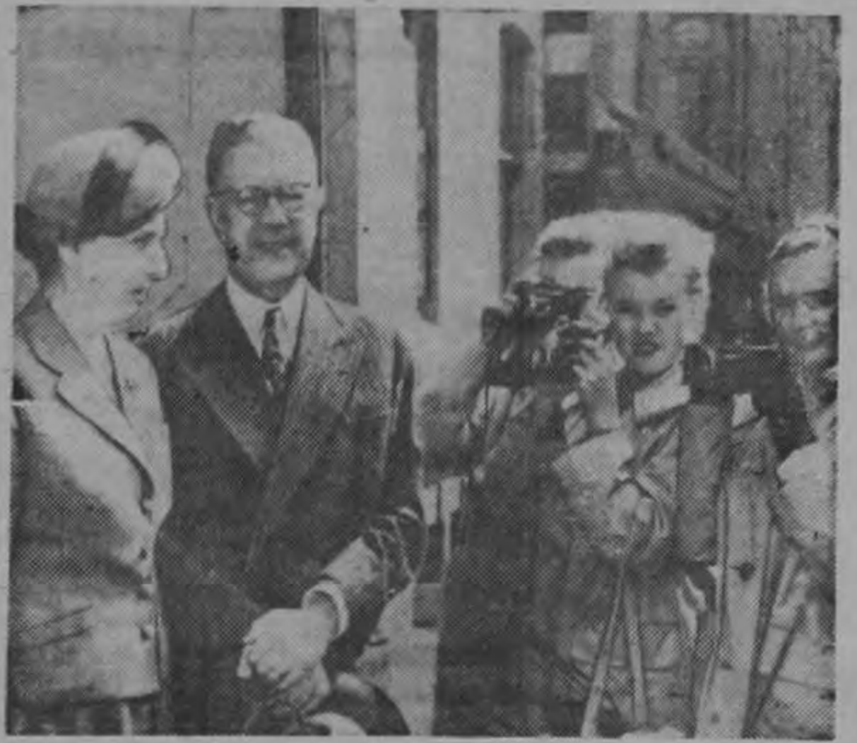
El Rey Gustavo Adolfo de Suecia y la Reina Lousa con un joven fotógrafo aficionado al salir de la iglesia sueca en Londres después de inspeccionar los decorados internos. El Rey y la Reina están en una visita extraoficial de 13 días a Inglaterra. Las tres niñas son suecas y también están visitando a Londres.

El Dr. Pi Suñer ofrecerá hoy jueves una conferencia en el Paraninfo del Colegio de Médicos sobre un tema de endocrinología, la cual no dudamos será de gran importancia en los círculos médicos.