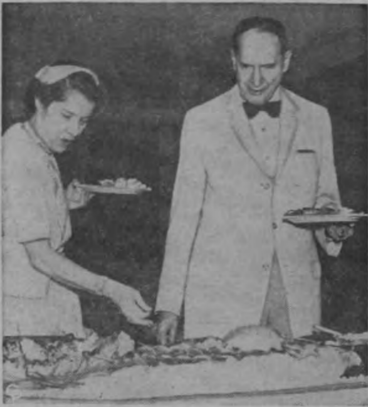
El General Douglas MacArthur y su esposa se proveen en un almuerzo-ambigú al que asistieron en Boca Ratón, Florida. El "Viejo Soldado" y su esposa están de vacaciones en la Florida.

En Venezuela la lucha contra la dictadura del General Pérez Jiménez abarca a todos los partidos políticos democráticos. En fecha pasada publicamos las declaraciones del líder del Partido Acción Democrática, don Rómulo Betancourt, en las cuales se planteaba como una solución al problema venezolano la próxima convocatoria a elecciones presidenciales que ordena la propia Constitución que se hizo elaborar Pérez Jiménez, dentro de un margen mínimo de libertades públicas. Ayer hemos recibido desde Nueva York las declaraciones del doctor Jovito Villalba que publicamos a continuación. El Doctor Villalba líder del Partido Unión Republicana Democrática; exultado en 1952 cuando ganó las elecciones para elegir Asamblea Constituyente, apoyado por el Partido Acción Democrática des de la clandestinidad.