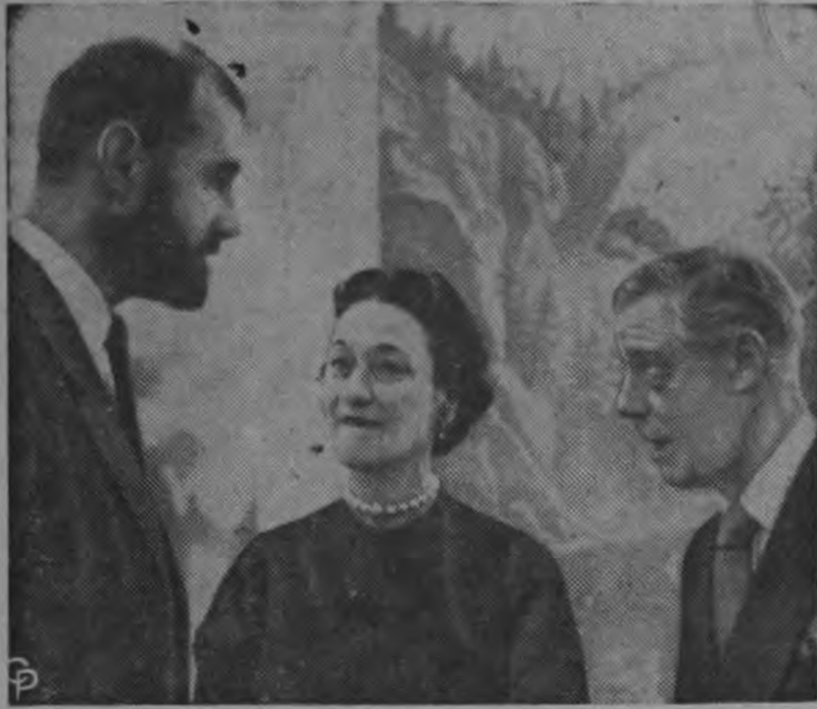
Los Duques de Windsor aparecen conversando con el artista Morris Graves, en una recepción en Nueva York, en la que se anunció que Graves era el ganador del primer Premio Windsor concedido en los Estados Unidos. Un artista francés será seleccionado en mayo.