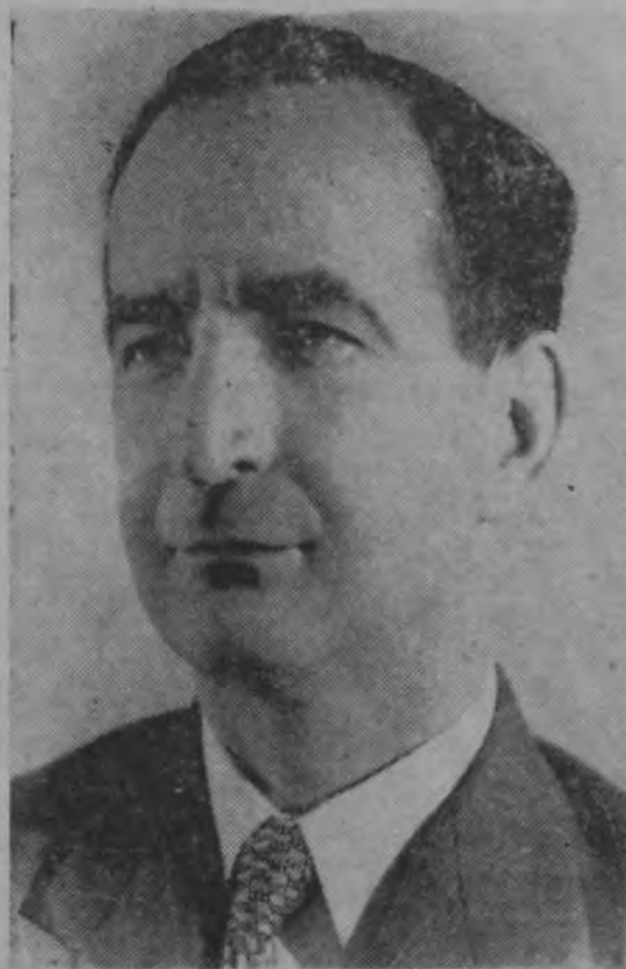
DON JOSE FIGUERES Presidente de la República

Hoy celebra el aniversario de su natalicio, don José Figueres, Presidente de la República